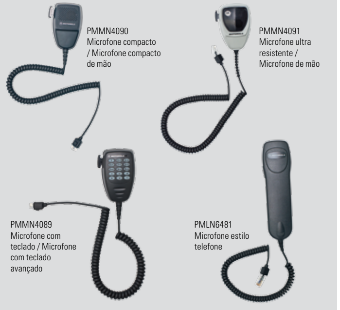
PMMN4090 Microfone compacto / Microfone compacto de mão